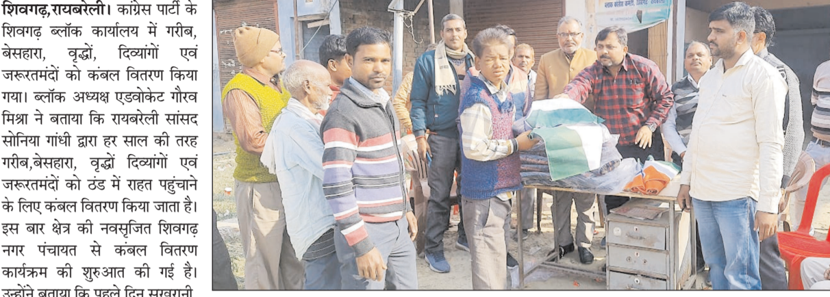
न्यूज गाइड, संवाददाता