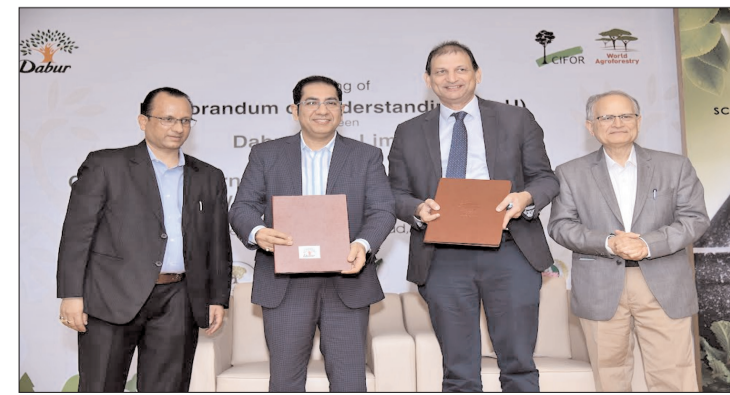
लाने के लिए विशाल अभियान की शुरुआत की। इस अभियान के द्वारा मेडिसिनल एवं

लखनऊ। भारत की अग्रणी विज्ञान पर आधारित आयुर्वेद कंपनी डाबर इंडिया लिमिटेड ने आज सेंटर फॉर इंटरनेशनल फॉररेस्ट्री रिसर्च एवं वर्ल्ड एग्रोफॉररेस्ट्री के साथ मिलकर उत्तर प्रदेश, हरियाणा, राजस्थान, उड़ीसा, आन्ध्र प्रदेश, असम और तमिलनाडु में एग्रोफॉररेस्ट्री का उपयोग करते हुए वनों के बाहर आर खेतों में पेड़ों एवं पौधों में सुधार