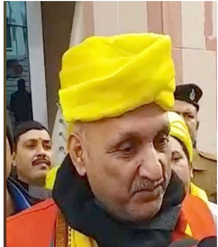
की आस में अपने आराध्यों पर हमला होते देखता रहता है। सवाल उठता है कि क्या कर रही हैं हमारी

बिहार के मुख्यमंत्री नीतीश कुमार वैसे तो सुशासन बाबू के नाम से जाने जाते हैं लेकिन आजकल उन्हें पता नहीं क्या हो गया है। बिहार में क्या हो रहा है? कौन मंत्री क्या बयान दे रहा है इस पर उनसे सवाल पूछो तो उन्हें कुछ पता ही नहीं होता। बिहार में चल क्या रहा है? उन्हें सत्तारूढ़ गठबंधन की सबसे बड़ी पार्टी राष्ट्रीय जनता दल के प्रदेश अध्यक्ष जगदानंद सिंह ने कहा कि राम मंदिर नम्रत की जमीन पर बनाया जा रहा है। अब बिहार के शिक्षा मंत्री चंद्रशेखर ने रामचरितमानस को नम्रत फैलाने वाला ग्रंथ बता दिया है। क्या इस देश में हिंदुओं की भावनाओं पर प्रहार पर प्रहार किये जाते रहेंगे? कभी कोई रस तन से जुदा की धमकी देता है तो कभी कोई राम का, शिव का या देवी दुर्गा का अपमान कर देता है। लेकिन हिंदू से अपेक्षा की जाती है कि वह सहिष्णु रहे, कानून को उसका काम करने दे। हिंदू सहिष्णु बना रहता है, कानून को उसका काम करने देता है और एक दिन न्याय मिलने