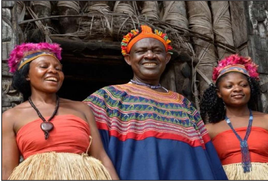
बच्चे हैं। आमतौर पर रानियां अच्छी वक्ता होती हैं। कई भाषाओं की जानकारी होती है और पढ़ी लिखी होती है। कैमरून में बहु विवाह को कई बार चुनौती भी दी